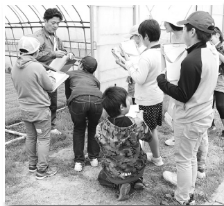
(5/15 小学生育苗センター見学)