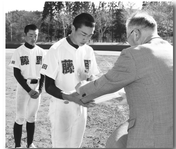
(5/3、4 第37回清水袋公園野球場記念大会)