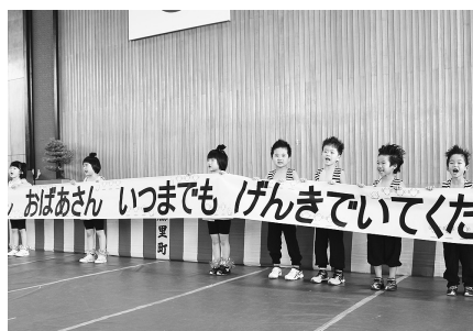
いつまでも元気でいてください