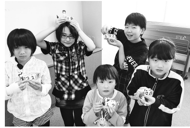
図書室では「おはなし会」のほか「工作」「クッキング」など子ども向けにさまざまなイベントを開催しています。おうちの方もどうぞお気軽にご参加ください!