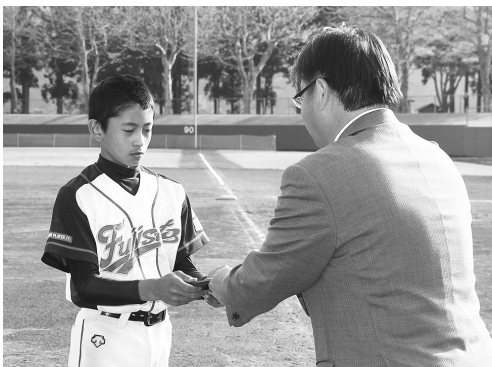
優秀賞おめでとう

初戦を快勝した藤里クラブでしたが、決勝戦では白岩ベースボールクラブ（仙北市）と互いに譲らぬ熱戦となりましたが、白岩ベースボールクラブの止まらぬ打線に敗れ、準優勝となりました。今後の活躍に期待しましょう。