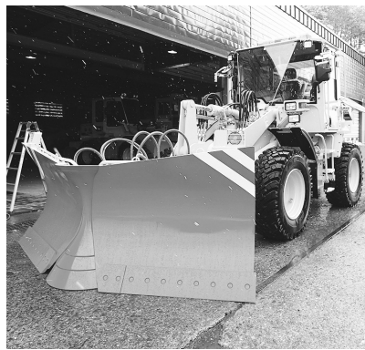
今年更新した新型車両