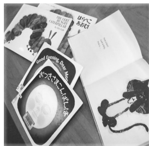
展示図書の一例を紹介しています。このほかにもたくさん用意していますので、ごらんください。

秋田県立図書館所蔵の資料をお借りして、みなさんにおなじみの絵本が英語バージョンで楽しめるコーナーをつくりました。 ひとつのおはなしを、日本語と英語で楽しむことができます。 この機会にどうぞご利用ください。