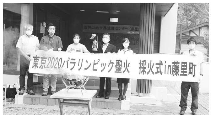
採火式（遺産センター）