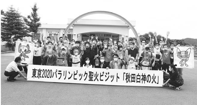
聖火ビジット（虹のいえ）