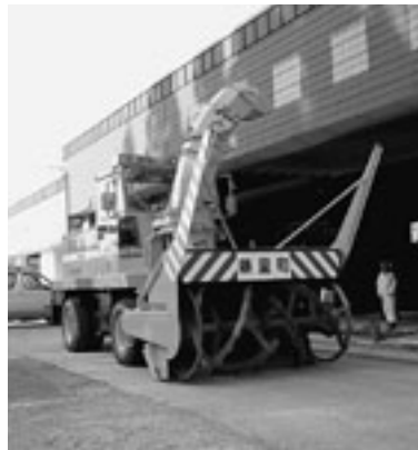
今年導入した新型除雪車

除雪作業は主に交通量の少ない早朝や夜間に行います。ご迷惑をおかけしますが、ご理解ください。