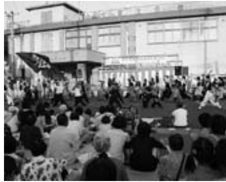
素波里貉と二ツ井恋舞のコラボ

このほか、藤里町町制施行50周年記念事業実行委員会による、来年の施行記念をPRするブースも設けられ、実行委員らが町の50周年を知ってもらおうと奮闘していました。