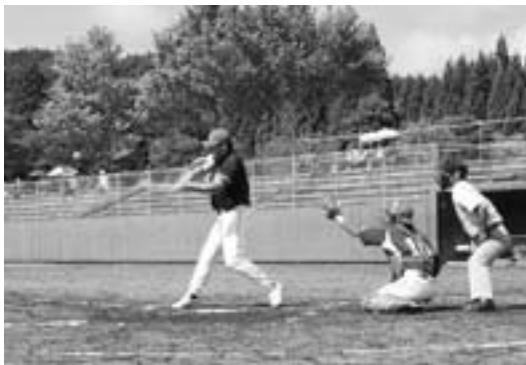
ナイスバッティング！

8月14日、清水岱公園野球場において、恒例の地区交流野球大会が開かれました。この大会を目当てに帰郷する方もいるということ、この日も、藤琴、大沢、粕毛、中通、矢坂、米田からそれぞれチームが参集し、炎天下の中、ファイナルプレーや時には笑いを誘うプレーを繰り広げながら、白球を追いかけていました。第17回町地区交流野球大会を制したのは、昨年に引き続き藤琴地区チームとなりました。