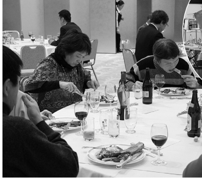
メイン料理を堪能