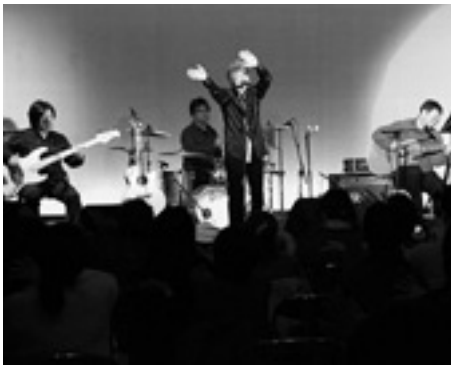
歌とトークで会場は大盛り上がり

この日は、大館市を拠点に活動するダックスムーンが出演し、JAみどりの広場のテーマソングとしても知られる「パノラマを越えてTry」など13曲を熱唱、軽快なトークで会場を盛り上げました。