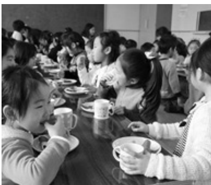
桜もちおいしいね