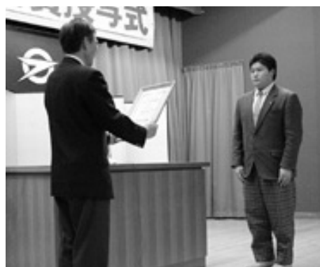
益々の活躍を期待します