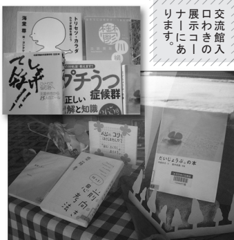
交流館入 りまわりの 展示コー ナリにあ ります。

読みたい本が見つからないとき、貸し出し 中のとき…お気軽にカウンターに係まで お問い合わせください!!