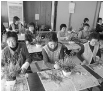
丁寧に作っています

参加者は、講師がアレンジした見本を参考に、オリジナルのフラワーアレンジを完成させていました。