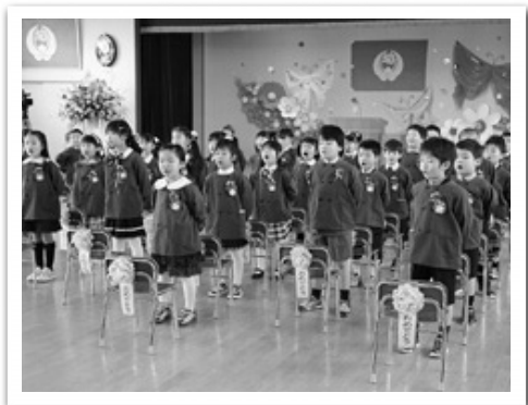
みんなおおきくなりました（藤里幼稚園）