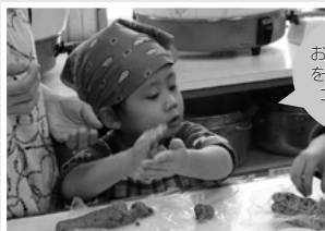
おねえちゃん を見習って、 コネコネ…

アーノルド・ローベルの絵本に登場する「がまくんとかえるくん」が一緒に食べたクッキーにちなんで、みんなで楽しく作って、おいしくいただきました。