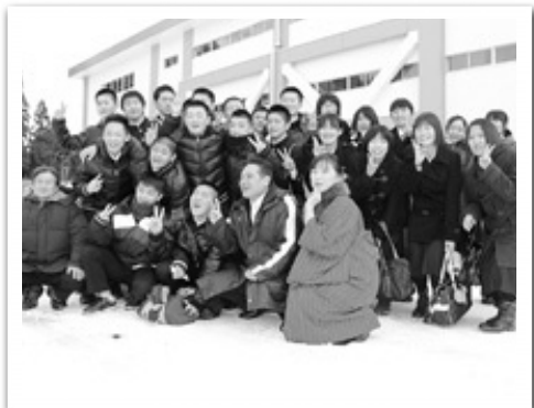
先生、仲間たちと（藤里中学校）