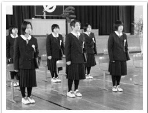
立派に成長しました（藤里小学校）