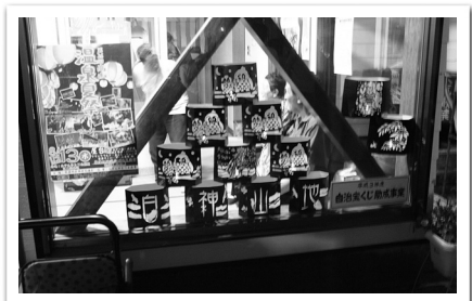
ライトアップされた夢灯り