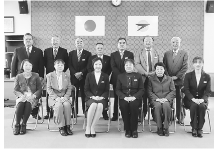
よろしくをお願いします。

民生委員・児童委員は、厚生労働大臣及び秋田県知事から委嘱され、それぞれの地域において、常に住民の立場に立って相談に応じ、必要な援助を行い、社会福祉の増進に努める方々であり、任期は3年間（令和4年12月1日～令和7年11月30日）となります。