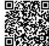
国税庁LINE公式アカウント

※入場整理券の配付状況に応じて、後日の来場をお願いする場合がありますので、ご了承ください。