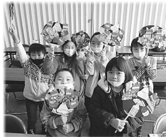
かわいらしいお正月かざりとともに、楽しい年末年始を迎えられたことと思います!

ふれあいルーム (旧おやこのえほんルーム) では、夜間に空間除菌機器を作動させ、感染症拡大予防に努めておりますが、入室前に入り口での手指消毒にご協力をお願いいたします。