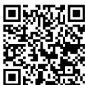
確定申告特集ページ

申告作成会場では、ご自身のスマホにより、ご自身で申告書等作成していただきますので、 スマホ と マイナンバーカード をお持ちください。