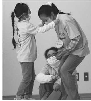
6年生へメダルを贈ります

2月17日、小学校において、6年生ありがとう集会が行われました。 この日は、卒業間近の6年生のために、在校生が一同となって会を主催しました。会の中では、これまで学校を牽引してくれた6年生へ、在校生が様々な贈り物とともに感謝の言葉を伝えていました。