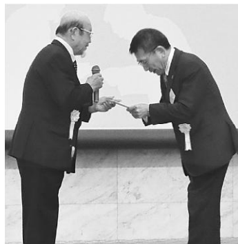
寄附金が贈呈されました