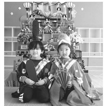
仲良く記念撮影（幼稚園）