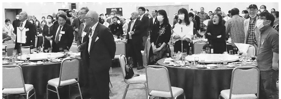
みんなで「ふるさと」を熱唱

在京藤里会の中で、細田会長より「藤里町の子どもたちのために役立てて欲しい」と藤里学園へ図書券を、白神山地世界自然遺産登録30周年記念事業（環白神ツーリズム推進協議会）への寄附金をいただきました。有効に利用させていただきました。ありがとうございます。