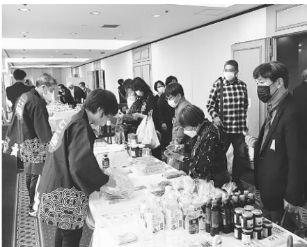
大盛況だった特産品販売