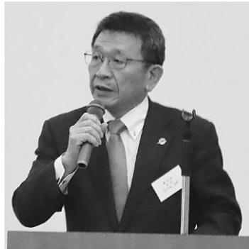
町長による藤里町の現状報告