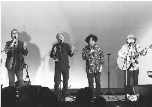
大興奮のステージ！

この日は、大館市を拠点に活動するダックスムーンが出演し「藤里物語」など多くの名曲を熱唱、そして軽快なトークで会場を盛り上げました。