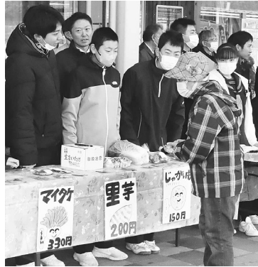
特産品を紹介しました

悪天候の中での開催となりましたが、10時30分からの販売開始と同時に元気な声で呼び込みを行い、訪れた多くのお客様に藤里町の特産品の紹介をして好評を得ていました。