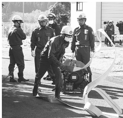
有事の際の動きを確認しました

が行われ、町内5つの分団から68名が参加しました。水防訓練では、消防署員から土のうの作り方や工法について指導を受け、手順について理解を深めていました。想定訓練では、藤里浄化センター付近の原野からの出火を想定した火災防ぎょ訓練と中継訓練が実施され、各分団が出火現場へ駆けつけ、伝達・中継・放水まで見事な連携で消火活動を行い、防災に対する意識を高めました。