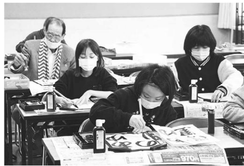
一筆一筆に集中しています