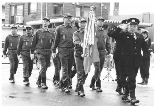
寒さの中、分列行進

神を養い、あらゆる災害から住民の生命財産を守る任務があります。住民の方々も、安心した日常生活を営むためにも、我々の消防活動は重要です。器具・機材の点検、整備を怠ることなく、有事の際には町民の付託に応え、地域住民の生命財産と安全を守るため一層の努力を望みます。」と無火災実現の願いを込め訓示をしました。 その後、長年にわたり消防活動等にご尽力された方々への表彰状、感謝状の贈呈が行われました。 式典終了後には、ラッパ隊の演奏に合わせ、役場前通りで分列行進を披露しました。