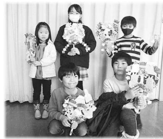
かわいらしいお正月かざりとともに、楽しい年末年始を迎えられたことと思います!

お正月工作教室開催! 〜折り紙工作で、お正月かざりをしよう〜 12月26・27日の2日間にわたり、町内の幼稚園・小学生とその保護者を対象に工作イベントを行いました。各日も、参加者の皆さんは今年の干支「辰」をはじめ、門松や獅子舞、梅の花などお正月にふさわしい折り紙かざりをたくさん作り、熊手に見立てたうちわに丁寧に飾り付けをしました。