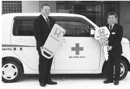
大切に使用させていただきます

1月25日、日本赤十字社から藤里町へ災害救援車1台が寄贈されました。今回寄贈された救援車は、災害時の救護資器材の運搬や避難者の輸送等救護、平時の福祉活動等に活用されます。