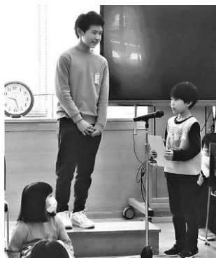
6年生を紹介します

くれた6年生へ、1年生から5年生が様々 な贈り物とともに感謝の言葉を伝えた後、 6年生クイズ、ペンつみつきみゲーム、じゃ んけんゲームを出席した前期課程の生徒 全員で行いました。 ゲームの後は、6年生から感謝の気持 ちを込めたダンスの披露とプレゼントが 贈られると、最後は出席者全員で「また 会える日まで」を歌った後に、6年生へ の感謝の気持ちが綴られたくす玉が割ら れました。