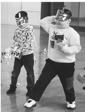
仲良く豆まき（幼稚園）

2月2日に藤里幼稚園、藤里保育園で節分の豆まきが行われ、赤オニに追い掛け回された園児らは、所狭しと会場を走り回りました。 必死に豆を投げつける子や恐ろしさのあまり泣き出してしまう子など様々でしたが、みんな元気いっぱい豆まきを楽しみました。