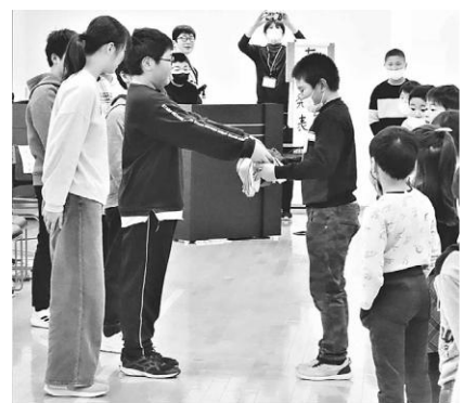
6年生からプレゼントが贈られました