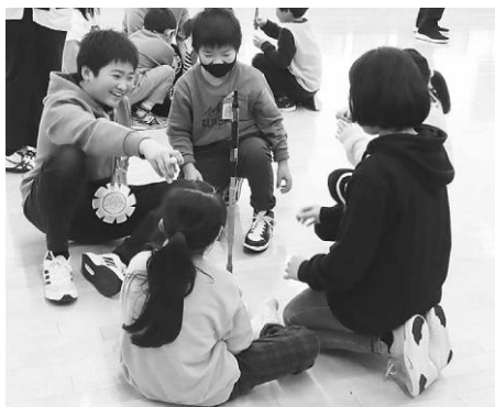
ペンを上手に積んでいます