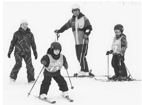
丁寧に教えてくれます