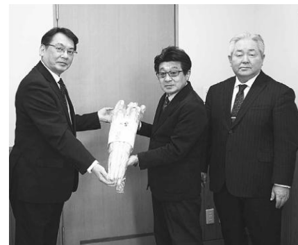
大切に使用させていただきます。

かな黄色で、さらに一部分が透明になっているため、児童の視野も確保されており、曇天時の歩行でも安全・安心な設計となっています。