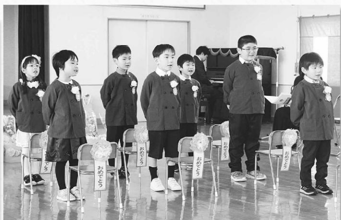
「世界が一つになるまで」を歌いました。(藤里幼稚園)