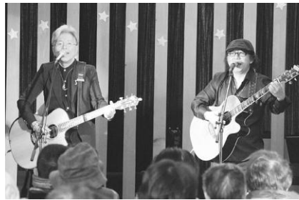
大興奮のステージ！

大館市を拠点に活動するダックスムーンが出演し、「藤里物語」など多くの名曲を熱唱、そして軽快なトークで会場を盛り上げました。