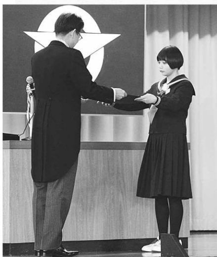
卒業証書を授与。(藤里学園)