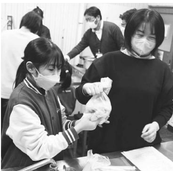
親子で楽しく調理しています。

講座には、13名が参加し、秋田県生涯学習センター職員が講師をつとめ、耐熱ビニール袋での調理や防災クイズを楽しんでいました。