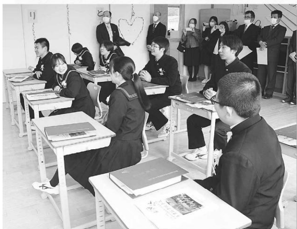
卒業式後、最後の学級活動。(藤里学園)