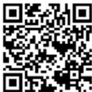
マリンスポーツ安全情報 「ウォーターセーフティガイド」