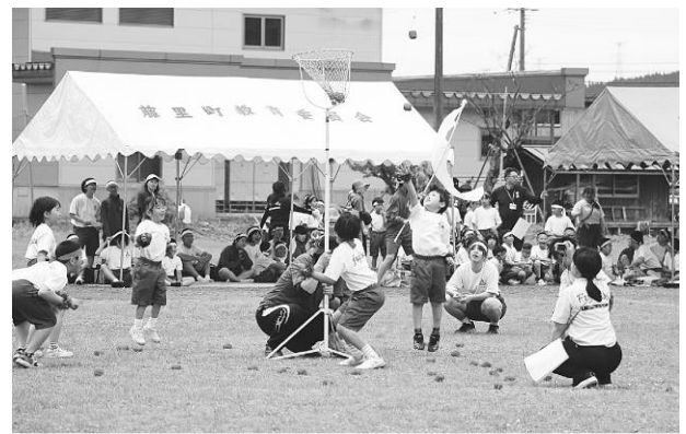
いくつ入ったかな?