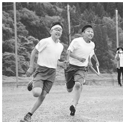
白熱した色別対抗リレー

この日は心配された雨も降らず、晴天に恵まれた中で開催することができ、短距離走や応援合戦、綱引きなど生徒たちの一生懸命な姿が見られました。最終競技の色別対抗リレーでは、白熱した展開に、会場が大いに盛り上がりました。