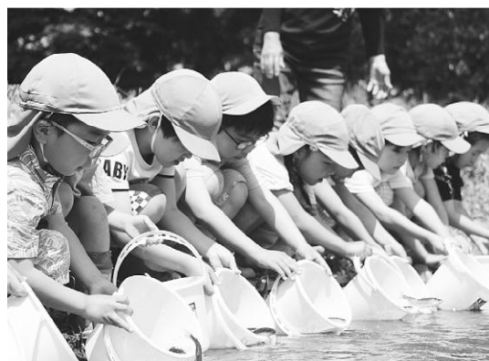
立派に大きくなってね!

粕毛漁協組合の方からそれぞれのバケツに稚アユを入れてもらい、「大きくなってね」と声をかけながら、みんなで川面に放しました。