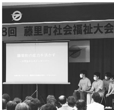
大学生からのメッセージ

続いてのトークセッションでは、「藤里町の底力を活かす」大学生からのメッセージ」と題して、秋田看護福祉大学、千葉商科大学の学生8名から新メニューの開発や宣伝方法などの提案があり、若者ならではの視点を活かした発想に参加者は関心を寄せていました。