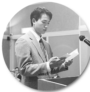
成人の誓いを胸に

引き続き行われた祝賀会では、久しぶりに顔を合わせた地元の仲間とともに、杯を酌み交わしながらそれぞれの思い出話を花を咲かせていました。