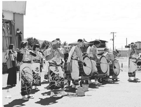
心地よい音色が響く（志茂若）

9月8日浅間神社例大祭が行われ、県無形民俗文化財の藤琴豊作踊りが奉納されました。この日は、浅間神社で神事を行った後、今年の当番である上若を志茂若が先導する形でおみこし行列が町内を練り歩き、各所で駒踊りを披露しました。御旅所となった開発センター前では、棒使い、獅子舞、駒踊り、奴踊りなどが披露され、観衆から盛大な拍手がおくられました。