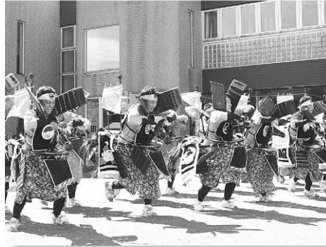
迫力ある駒踊り（上若）