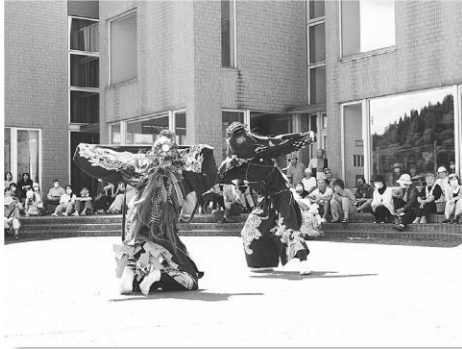
華麗に舞う獅子舞（上若）