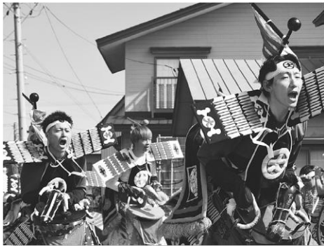
力強い駒踊り（志茂若）