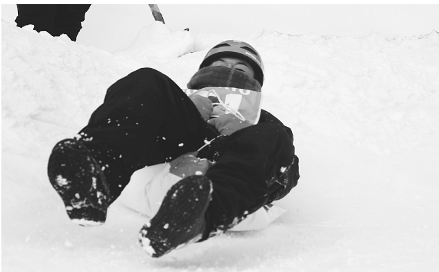
勢いよく滑ります

大会は、飛距離や飛んだ形の美しさを競うジャンプ競技と、コースを滑り降りる速さを競うタイムレースが行われ、会場は歓声で大盛り上がりでした。