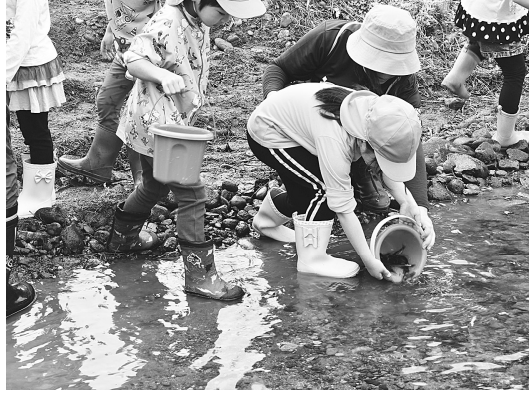
稚鮎を放流する園児たち

6月12日(木)、藤里幼稚園のうめ組園児らによる鮎の放流体験が行われました。当日は時折雨の降る少し肌寒い天気でしたが、長靴を履いた園児たちは、川の中まで入って元気に鮎の放流を行っていました。