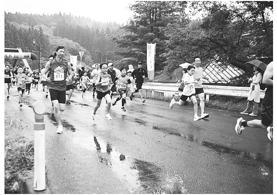
雨の中、ペアマラソンの選手たちが一斉にスタート

6月22日(日)、第12回白神山地ブナの森マラソン(主催:白神山地ブナの森マラソン実行委員会)が開催されました。当日は朝から雨の空模様でしたが、県内外から集まったランナーたちは悪天候の中、アップダウンの激しいコースに挑み、それぞれのペースでゴールを目指していました。