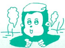
ほくは藤里町の マスコットキャラクター ユッター です。

編集後記 建設課担当者をお願いをし、藤里浄化センター(大沢)を見学。まだフル稼働ではないものの、やはり水の循環設備というのは複雑で、そして大切なものだと再確認した。今年9月を予定している「白神山水」の販売もそうだが、これからもここに住み水を利用するのならば「フナ」だけには任せておかないであろう▼先日庁舎の屋根下でスズメの泣き声が聞こえた。巣があるようで時折耳を傾けていたが、ある時、地面に巣の一部が落ちており、中にはヒナが三羽、親鳥を呼んでいた。友人が空き箱の中へ入れてやり、しばらくたつと親鳥がえさを与えていた。ホッと一安心もつかの間、翌日には2羽が体力も無く逝ってしまった…。残った一羽の姿が小さく、不安に思っていたそのとき、頭上を数羽のスズメが飛んでいった(孝)