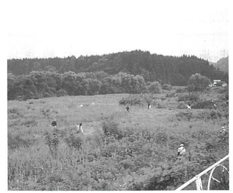
広大な面積を作業中