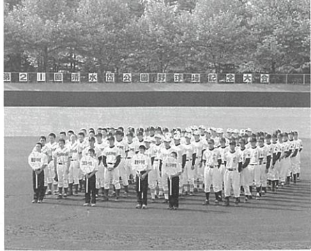
強豪そろいの大会です

6月8日と14日の両日、第21回清水岱公園野球場記念大会と第10回藤里町招待中学校卓球大会が、清水岱公園野球場、