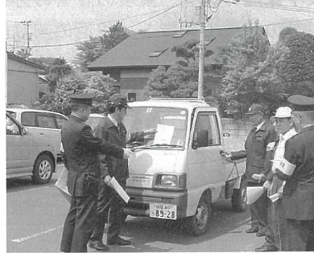
日頃からの注意が一番

地域安全運動の一環として、三世交代流館駐車場と開発センター周辺の駐車中の車を対象に、5月23日、防犯指導隊と駐在署員による車の施錠確認がおこなわれました。 最近も隣町等で自動車の盗難未遂事件が発生するなど、近年は地方においても同様の事件が多発するようになっていきました。 一同は置かれてある車のドアロック状態を一台一台確認しながら、ロックされていない車にチラシを配布するなどして、車上荒らしや盗難への注意を促していました。