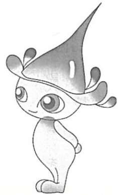
会員としての加入手続き

「白神山地の水の会」会員募集 水は貴重な資源です。安全な水は、買い求めて飲む時代となってきました。藤里町では現在、世界自然遺産白神山地の水の生産工場を平成15年9月の完成を目指し建築中で、9月中旬のオープンを予定しています。町ではこの水を通じて白神山地の保護、又、会員の身近に地震災害等発生した場合に、優先して水を供給するというネットワークづくりを全国展開するため、会員を募集しています。