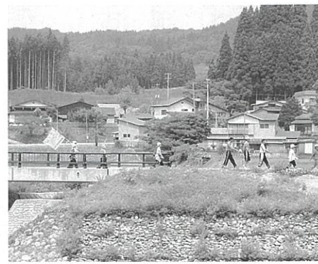
桜つつみを軽快に

峨嵋大滝を経由する緑に包まれた中通地区コース5kmを、心地よい風に吹かれながらおよそ50分かけてゆっくり散策していました。