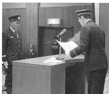
表彰状が授与されました

役場前通りで近隣住民や町議会議員の見守る中、一糸乱れぬ分列行進を披露した一行は、続く式典に参加。殉職職員及