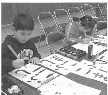
出来ばえはいかが?