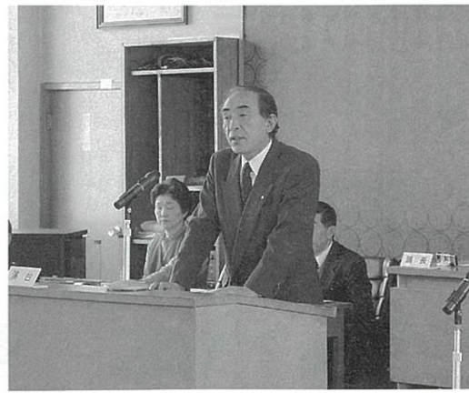
厳しい結果となった昨年